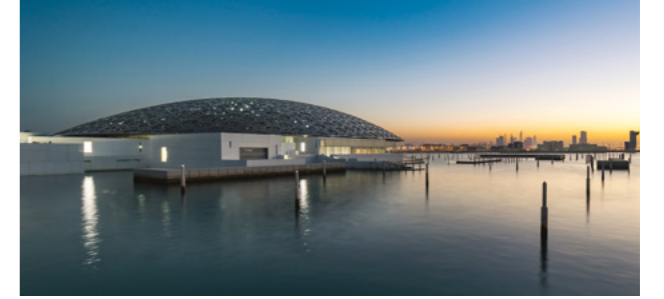
متحف اللوفر أبوظبي

This pioneer cultural project gathers different cultures to immerse the visitor in an artistic journey.