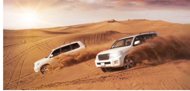
رحلات سفاري في الصحراء

Majestic sand dunes and authentic camel rides enliven the Arabic spirit from the most exciting safari trip.